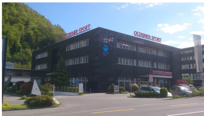
Ausgleichskasse / IV-Stelle Nidwalden